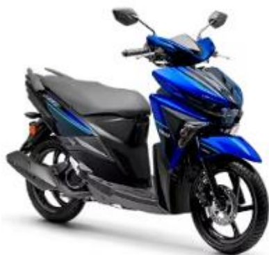
NEO 125 UBS

3.4.6. YAMAHA: A marca oferta duas opções de motocicletas de baixa cilindrada, modelos FLUO ABS e NEO 125 UBS, ambas de aplicação urbana, com características que dificultam o tráfego em estradas não pavimentadas, a saber: câmbios automáticos, rodas de liga leve, posição de pilotagem, distância do para-lamas para o pneu. Ademais a motocicleta possui uma carenagem intermediária, o que causaria avarias facilmente com o uso frequente em estradas não pavimentadas e em possíveis quedas.